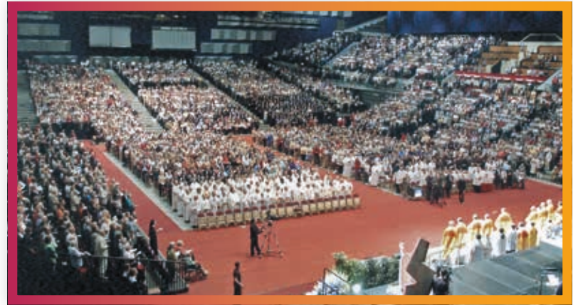
Maria Namen-Feier: Gemeinsames Gebet in der Wiener Stadthalle, seit 2011 im Stephansdom

Die Förderung des Rosenkranzgebetes entspricht auch dem Wunsch des nunmehr heiligen Papstes Johannes Paul II. in seinem Schreiben zum Rosenkranz vom 16. Oktober 2002.