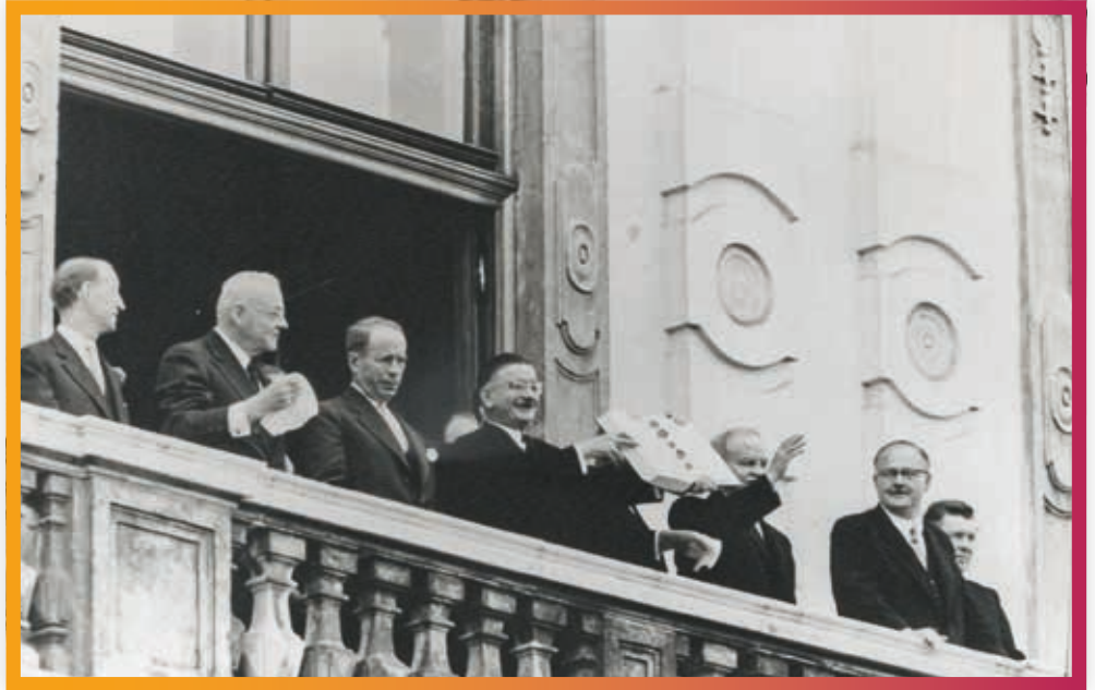
Außenminister Leopold Figl zeigte der jubelnden Menge den Staatsvertrag

in härtester Zeit durchzuhalten, ohne einen Fingerbreit von seinem eingeschlagenen Weg abzugehen. Nicht eine Spur unseres Gedankengutes, nicht eine Spur von unserem Glauben wurde geopfert. Mit einer Selbstverständlichkeit, die so viele in Bewunderung versetzte, haben die Österreicher alle Bedrückungen, selbst Verhaftungen und Verbannungen, über sich ergehen lassen, bevor sie ihren Glauben oder ihre Heimat auch nur im leisesten in Gefahr gebracht hätten. Die Macht des Glaubens war es, die uns aufrechterhalten hat; unser Gebet war unsere Waffe und unsere Stärke. ... Jenen Katholiken aber, die sich diesem Kreuzzug angeschlossen haben und die sich heute wieder zu einem machtvollen Bekenntnis für Glaube und Vaterlandsliebe vereinigt haben, will ich als Bundeskanzler aufrichtigen Herzens für die erwiesene Liebe, Treue und Opferbereitschaft danken. Diese unübersehbare Zahl gläubiger Katholiken Österreichs fordere ich