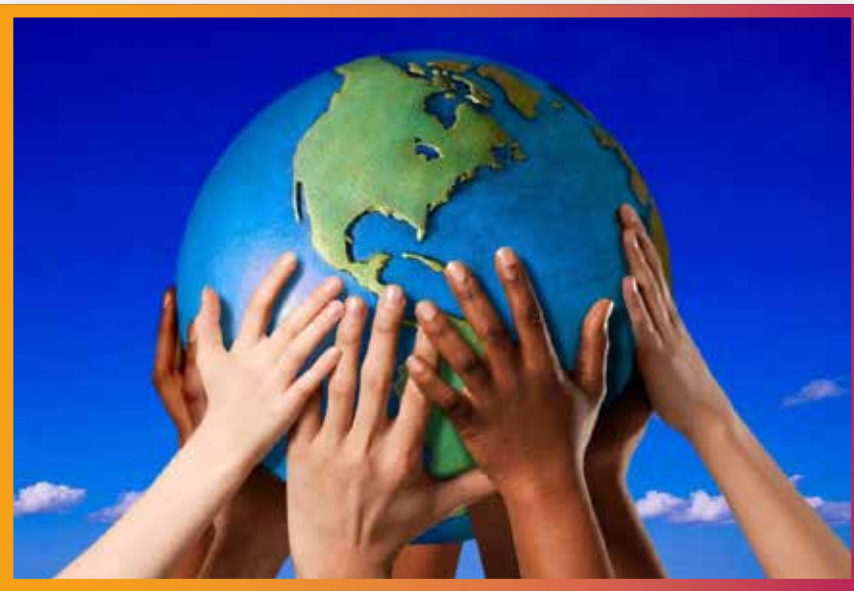
Der RSK verbreitet sich weltweit